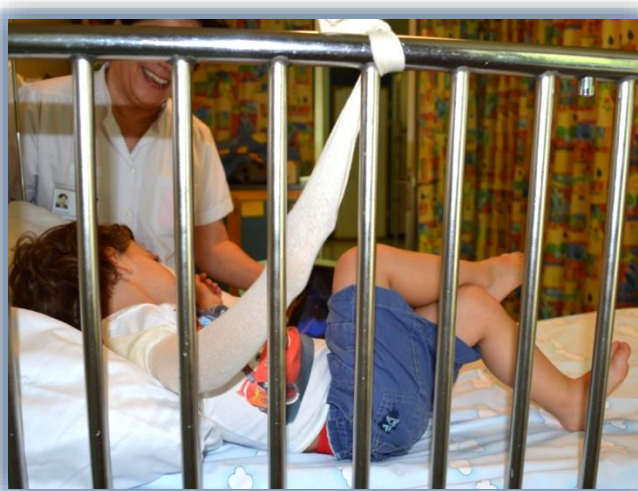
Extravasation au bras