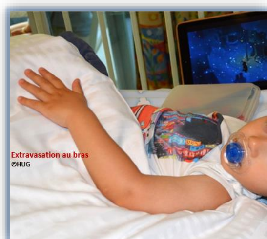
Extravasation au bras