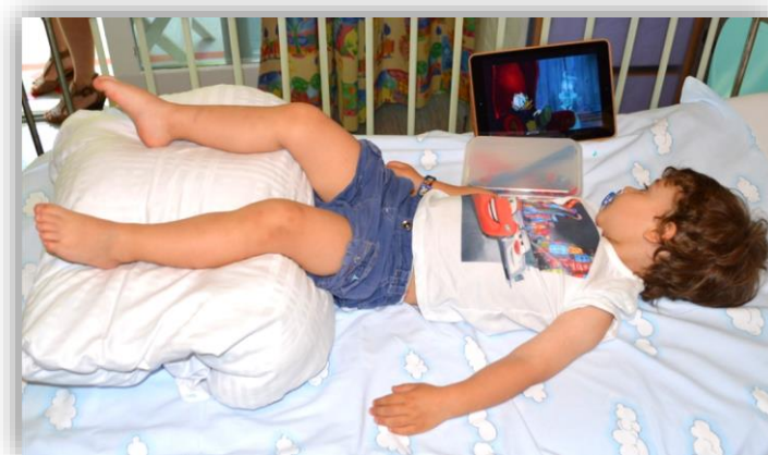
Extravasation au pied